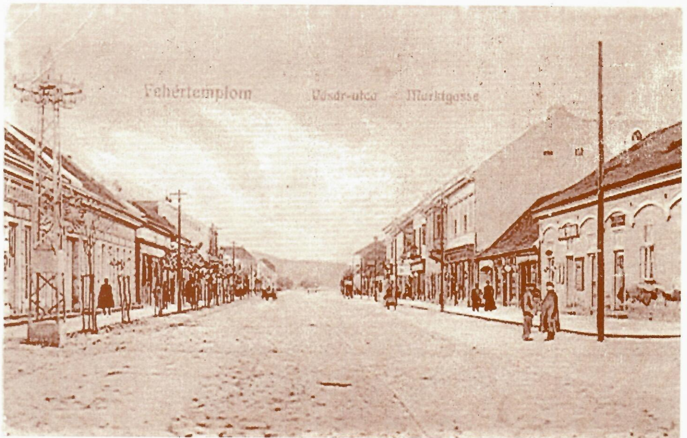
Данашња зграда Народне библиотеке у улици 1. октобра бр. 57 (прва зграда са леве стране)

Библиотека је од свог оснивања често мењала своје место, а у ову зграду, одмах до Хемболдове апотеке, смештена је после II светског рата. Пре тога, одмах по ослобођењу 1944. године, привремено је била смештена у Ристићевој кући која се налазила у близини, на углу улица 1. октобра и Пролетерске.